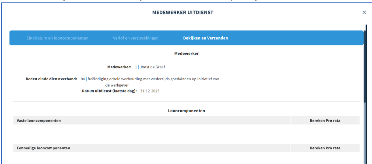
Figuur 4: Medewerker uitdienst 3

Wanneer u op Volgende heeft geklikt bevindt u zich in dit scherm (figuur 3). Hierbij is het van belang om ervoor te zorgen dat de uitbetalingen van verlofuren e.d. zijn aangevinkt.