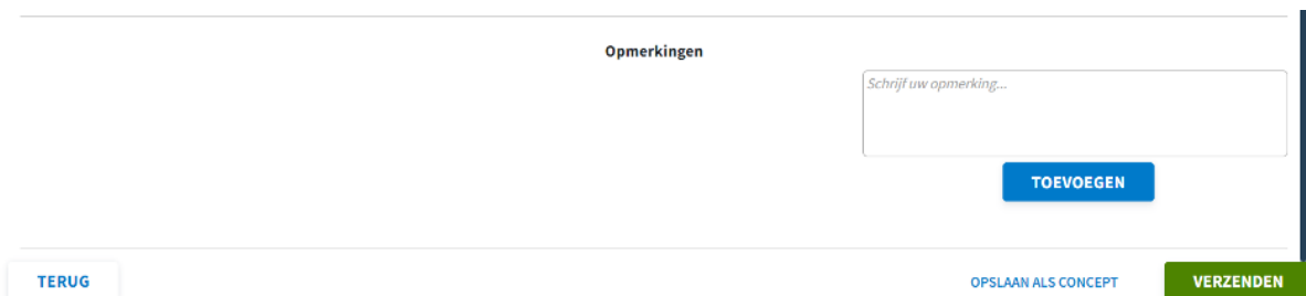
Figuur 5: Opmerkingen

Vervolgens krijgt u de uitdienstmelding in één overzicht te zien (figuur 4).